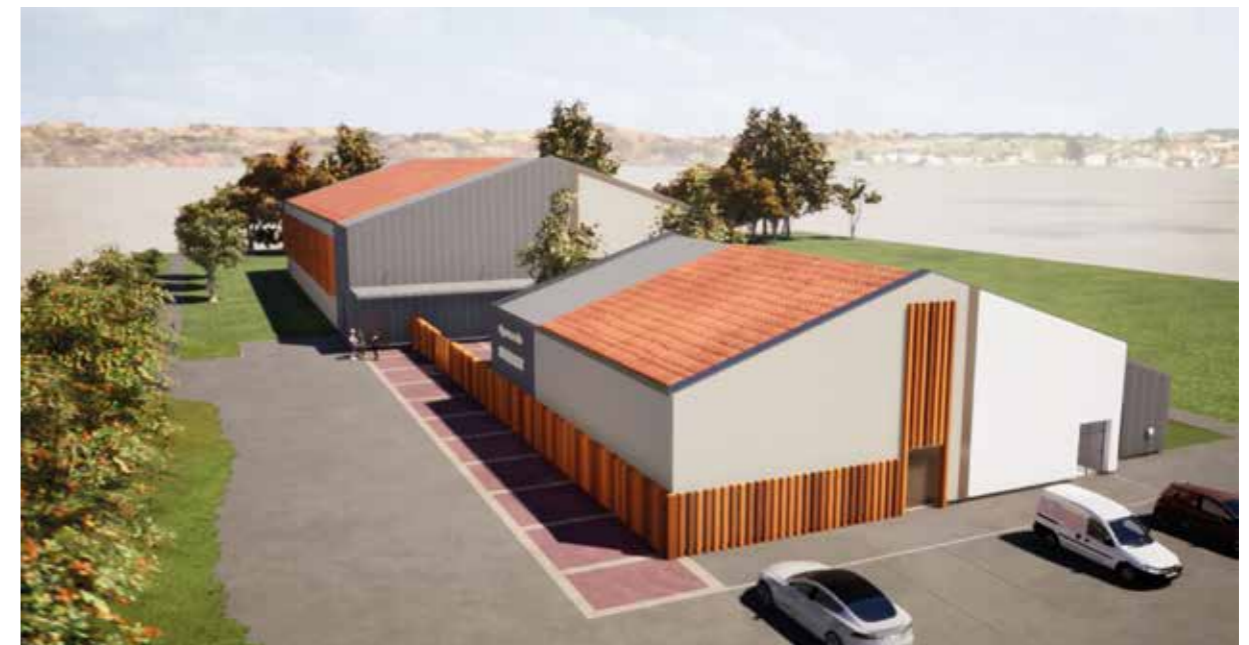
Projet de rénovation du gymnase de Mézériat

Une mobilisation de 3 millions d'euros permettra de remettre à niveau les équipements pour le tissu associatif tout en participant à la transition écologique. Ces deux projets s'inscrivent pleinement dans la volonté communautaire de réduire l'empreinte énergétique des bâtiments publics inscrite dans le Plan climat air énergie territorial (PCAET).