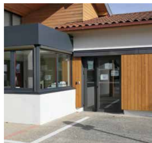
Entrée France Services - Veyle au Pôle des services publics de Vonnas

La Communauté de communes de la Veyle était, en 2017, l'une des premières du département de l'Ain à ouvrir une Maison de Services au Public (MSAP) sur son territoire. Ce lieu d'accueil des citoyens propose un accompagnement individuel et personnalisé pour les soutenir dans leurs parcours administratifs. La création de cette MSAP tient au constat qu'avec la fermeture de nombreux services dans les communes, la fracture numérique augmentait fortement, laissant de nombreux citoyens démunis dans la gestion de leurs démarches au quotidien. La mission principale de la MSAP est donc d'accompagner ces personnes. Deux postes informatiques connectés à internet et à une imprimante-scanner sont mis à disposition du