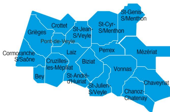
Carte 1 : Territoire d'intervention

La Communauté de communes de la Veyle a été créée le 1 er janvier 2017. Elle regroupe les 18 communes issues de la fusion des Communautés de communes des Bords de Veyle (CCBV) et du canton de Pont-de-Veyle (CCCPV) sur un territoire d'environ 212 km 2 , à l'Ouest du département de l'Ain.